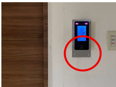
← 赤丸の部分にカードをかざしてください。

受付で受け取った「 面会カード 」をエレベーター横に右側の 【カード読み取り機】 に、ランプが点灯するまでカードをかざしてください。